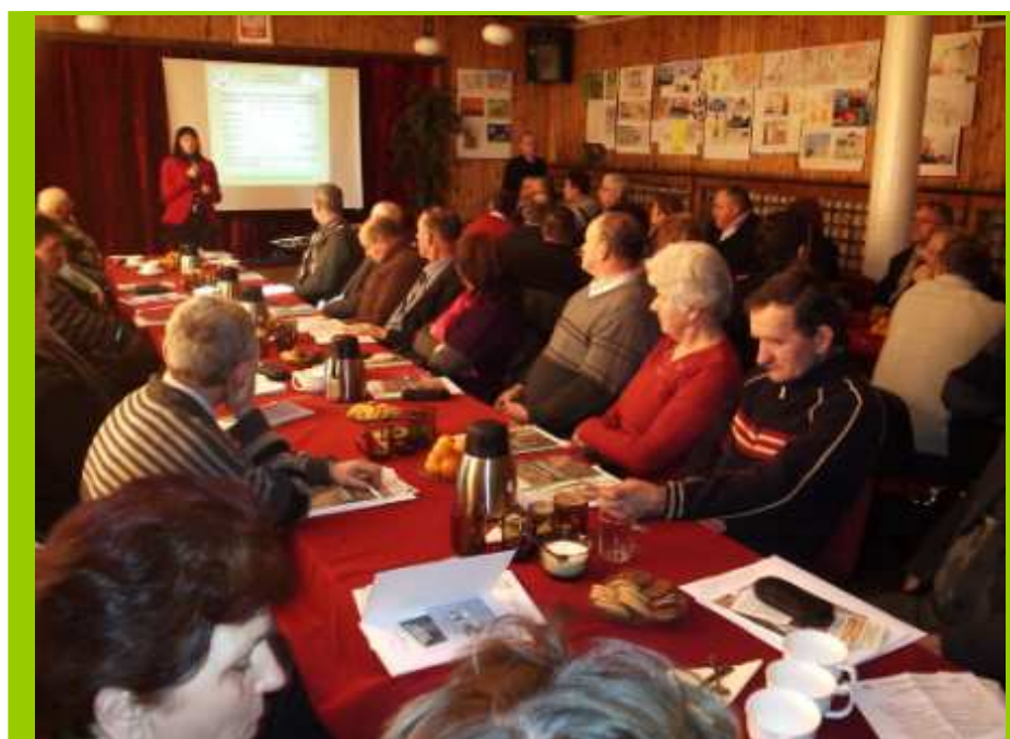
Szkolenie w Grzegorzewie